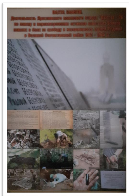
Стенд, посвященный отряду «Высота – 76»

В результате раскопок на местах боев были найдены подлинные вещи советских солдат. В центре витрины – письмо, написанное 9 мая 1945г.