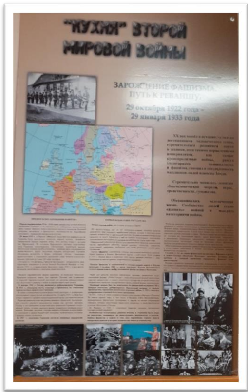
Выставка начинается с объяснения причин Второй мировой и Великой Отечественной войны. Стенды рассказывают о событиях, которые происходили перед войной в Европе и Азии.