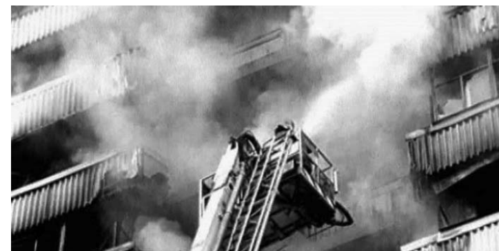
Пожарные делают все возможное для спасения людей