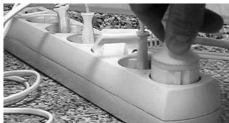
Пять электроприборов подсоединены к удлинителю. Существует опасность перегрузки электросети

В одном случае вы сами можете создать опасную ситуацию, нарушив правила использования оборудования и бытовых приборов. В другом случае независимо от вас может возникнуть опасная ситуация: резко возросло электронапряжение в сети, потек кран, перекрывающий воду в ванной, и др.