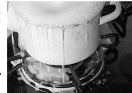
Оставленная без присмотра на газовой плите обычная кастрюля может привести к большой беде