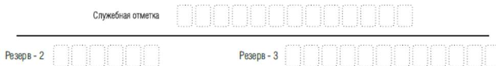
Рис. 5 Поля для служебного использования

Поля для служебного использования «Служебная отметка», «Резерв-2» и «Резерв-3» не заполняются.