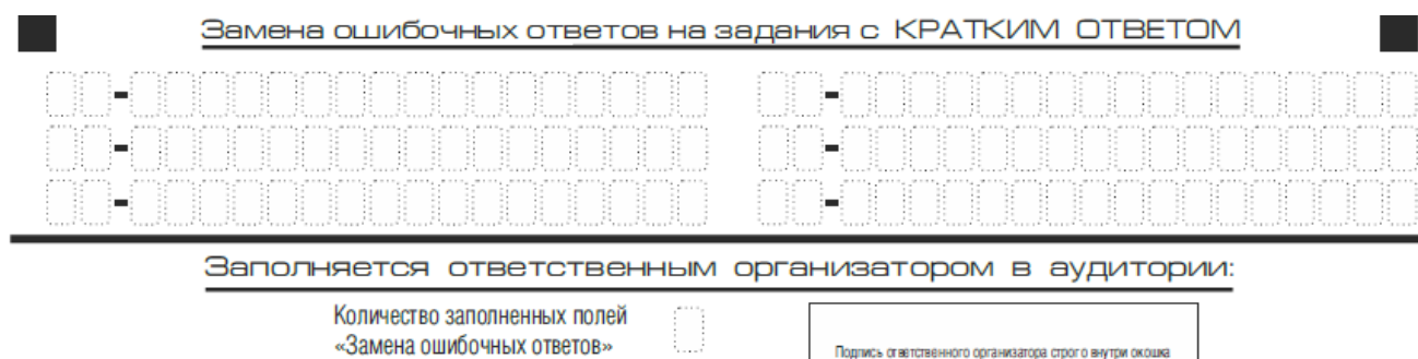
Рис. 9. Область замены ошибочных ответов на задания с кратким ответом

Запрещается записывать ответ в виде математического выражения или формулы. В ответе не указываются названия единиц измерения (градусы, проценты, метры, тонны и т.д.) – так как они не будут учитываться при оценивании. Недопустимы заголовки или комментарии к ответу.